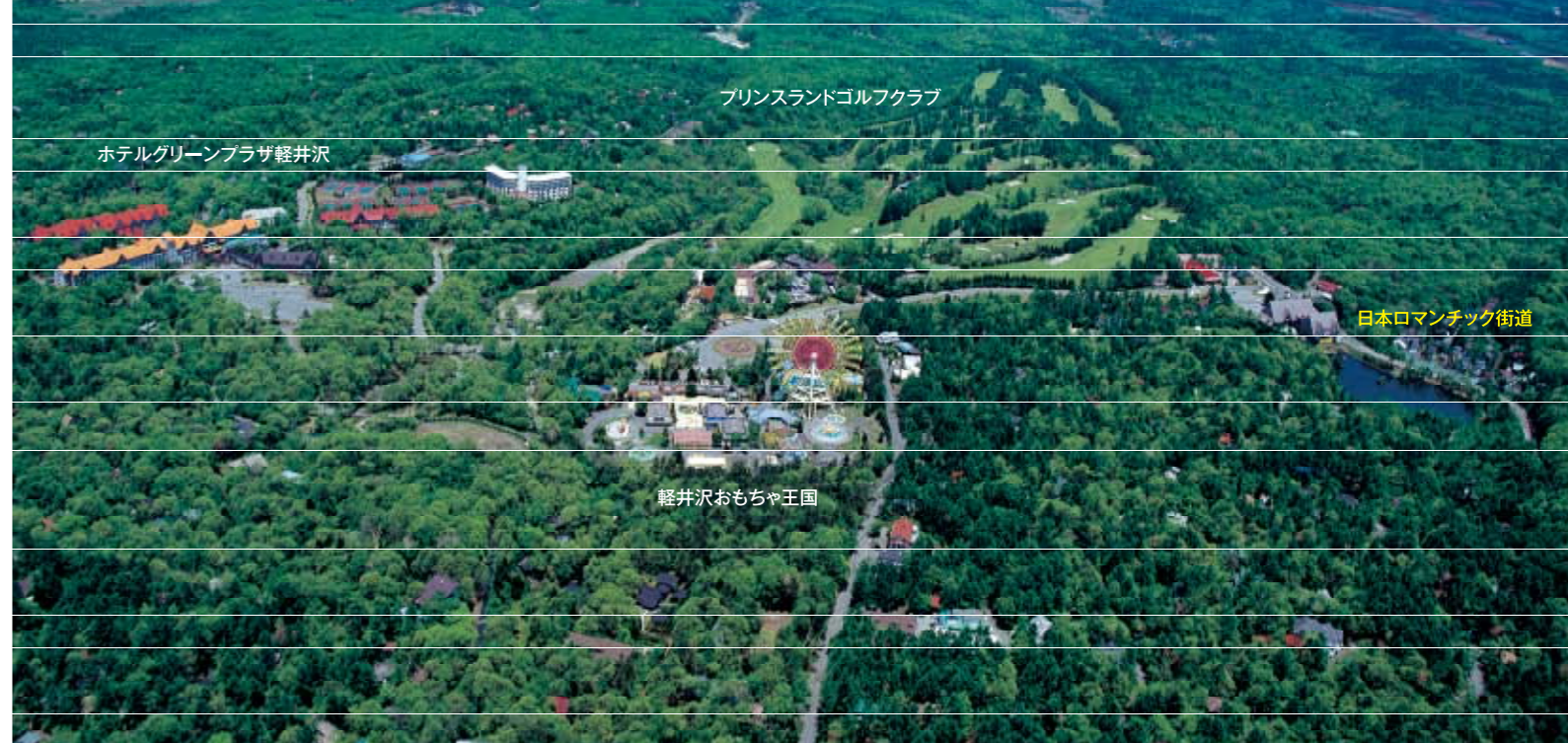
プリンスランドゴルフクラブ

期間:2009年5月30日(土)~6月28日(日) ※特定日のみの催事もございます。詳しくは中面をご覧ください。